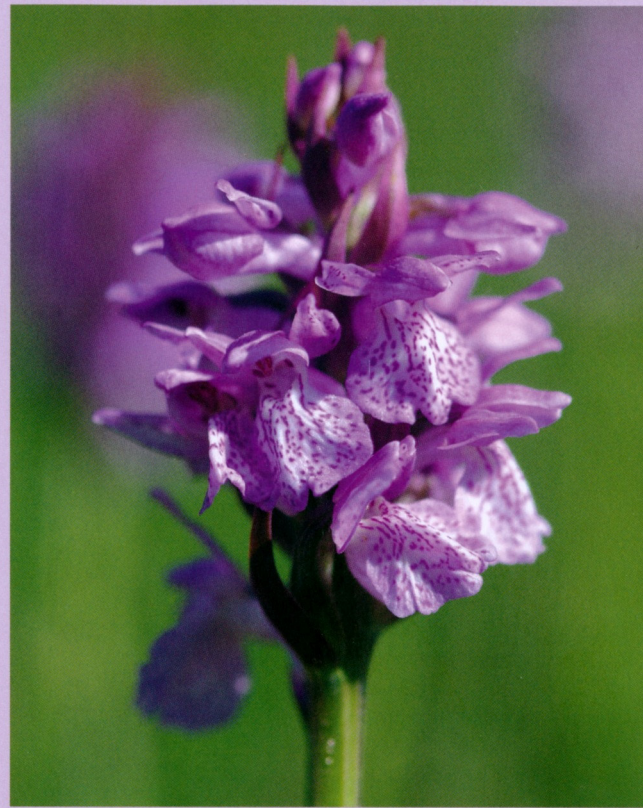
Blütenstand der Torfmoos-Fingerwurz

Die Torfmoos-Fingerwurz wurde erst verhältnismäßig spät als eigene Art beschrieben. Vermutlich ist diese Art auch erst in jüngerer Zeit entstanden. Im Jahr 1927 erschien die Erstbeschreibung des Autors Hans Höppner, der dafür Pflanzen aus Nordrhein-Westfalen zugrunde legte. Er hielt die Torfmoos-Fingerwurz damals für