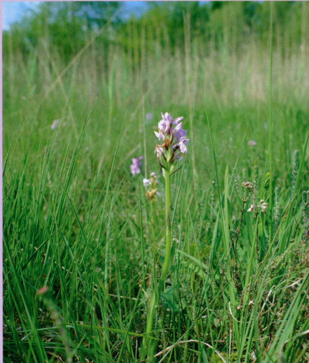
Moorbiotop der Torfmoos-Fingerwurz in Hamburg

Mit dem Rückgang unserer Moore ist diese Art akut bedroht und nach den Roten Listen Deutschlands und der Bundesländer »stark gefährdet« bis »vom Aussterben bedroht«. Ursachen sind Entwässerung, Überdüngung und Verbuschung der Wuchsorte. Durch die isolierten Vorkommen, sowohl der Art als auch der geeigneten Moorbiotope, ist eine weitere Ausbreitung schwer möglich, sodass die verbliebenen Bestände höchste Schützenswürdigkeit besitzen und ihr Erhalt eine wichtige Aufgabe für den Artenschutz in Deutschland darstellt.