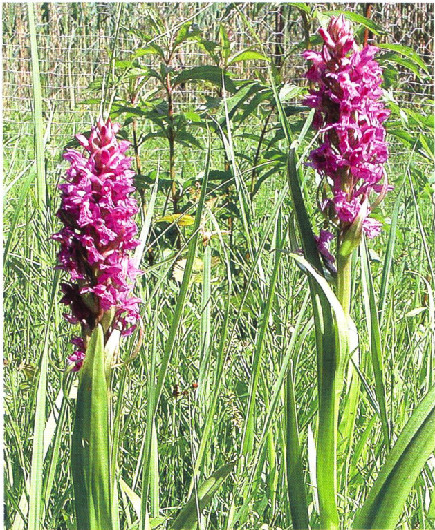
Ganzpflanzen im Lebensraum, Büttelborn, 24.05.2014

sachsen, Sachsen und Thüringen ist die Art „vom Aussterben bedroht. Für Bayern und Baden-Württemberg ist sie als „gefährdet“ angegeben. Alle übrigen Flächen-Bundesländer führen sie als „stark gefährdet“.