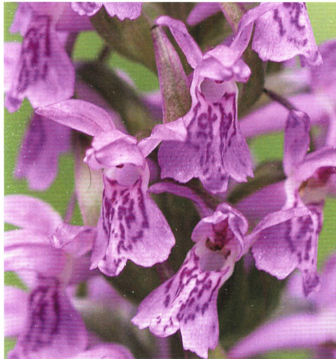
Einzelblüte, Leeheim, 31.05.2007

Ein anderer Name des Fleischfarbenen Knabenkrautes lautet Fleischfarbene Fingerwurz. Dieser bezieht sich auf die unterirdischen fingerförmigen Knollen. Sie gaben der Gattung den Namen Dactylorhiza , welche sich von den ovalen bis runden Knollen der Gattung Orchis unterscheiden. Die Arten aus beiden Gattungen werden bis heute im deutschsprachigen Raum als Knabenkräuter angesprochen.