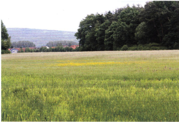
Biotop, Seligenstadt, 01.06.2006

Die Arbeitskreise Heimische Orchideen möchten in diesem Flyer eine seltene Orchidee vorstellen, die sie zur Orchidee des Jahres 2015 gekürt haben. Die Wahl fiel auf das Fleischfarbene Knabenkraut weil es in den letzten Jahren deutliche Veränderungen in ihren Lebensräumen gegeben hat, die zu einem Artenrückgang geführt haben. Unsere Betrachtung gilt somit der Orchidee selbst und ihrer Biotope.