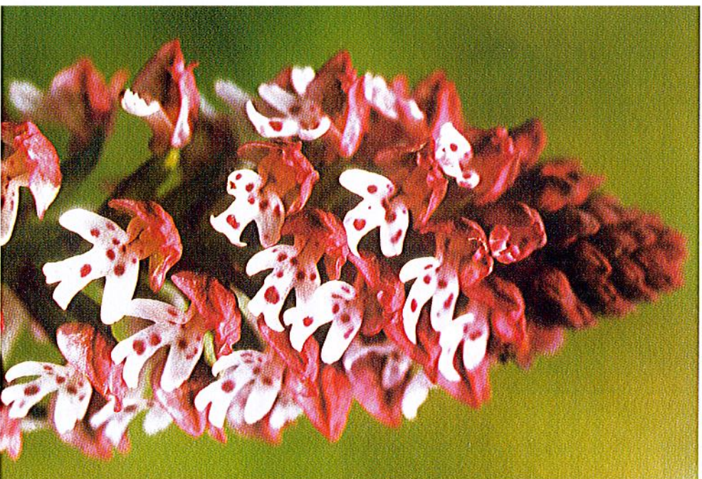
Brand-Knabenkraut, Spätblühende Varietät

Sie finden uns auch im Internet: europorchid.de / www.orchids.de