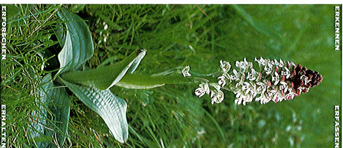
Brand-Knabenkraut Orchis ustulata L.