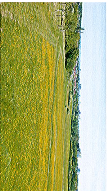
Lebensraum des Brand-Knabenkrauts in siedlungsnahen, frischen Hahnenfußwiesen