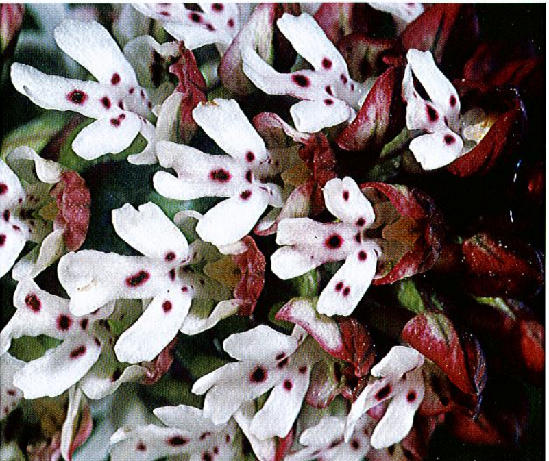
Ausschnitt aus einem Blütenstand von Orchis ustulata

Das Brandknabenkraut tritt in Deutschland in zwei Varietäten auf – eine im Mai bis Juni blühende Normalform ( Orchis ustulata var. ustulata ) und eine ca. zwei Monat später blü-